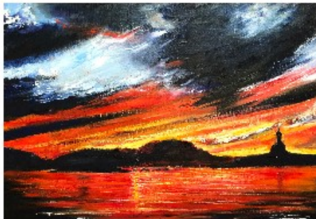
Lilia, Finistère, 2018

" Je ne peux m'empêcher de retourner aux bruits que j'aime, La parole des aînés, la vibration de la terre. " Joséphine Bacon, "Quelque part"