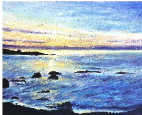
Cam Louis, Finistère, 2018

" C'était la fin des terres : les derniers doigts, noueux et rhumatismaux, Crispés sur rien. Des falaises Noires et menaçantes, et la mer qui explose." Sylvia Plath, "Finistère"