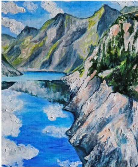
Lac d'Orédon, 2021