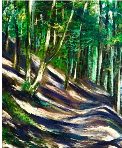
Les Rousses - Jura, 2019

" Je ne peux m'empêcher de retourner aux bruits que j'aime, La parole des aînés, la vibration de la terre. " Joséphine Bacon, "Quelque part"