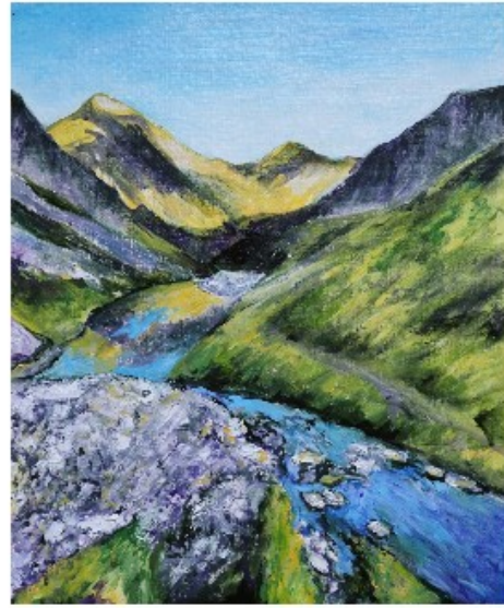
Parc de Néouvielle, 2021