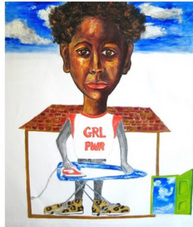
La repasseuse, 2019

"J'ai apprécié vos portraits. C'est vous la poétesse ! Votre imaginaire est plein de symboles et votre style les manipule avec maîtrise, on ressent votre bonheur à peindre. Votre travail a une âme." Gérard Garouste (peintre)