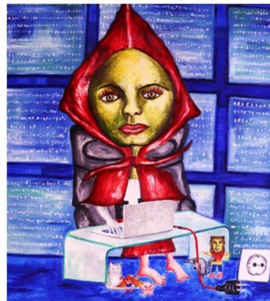
La Hackeuse, 2020