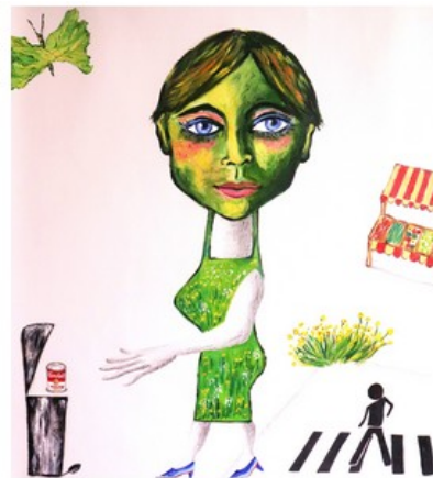
L'activiste écologiste, 2019