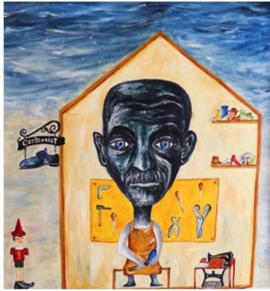
Le cordonnier, 2020