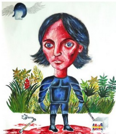
La policière, 2019

"J'ai été très impressionnée par la série des métiers. Un sujet gonflé, traité d'une manière très personnelle et libre ! J'aime le rapport entre les parties réalisées au crayon et les parties en couleur et l'intensité dans la peinture elle-même". Florence Obrecht (peintre) .