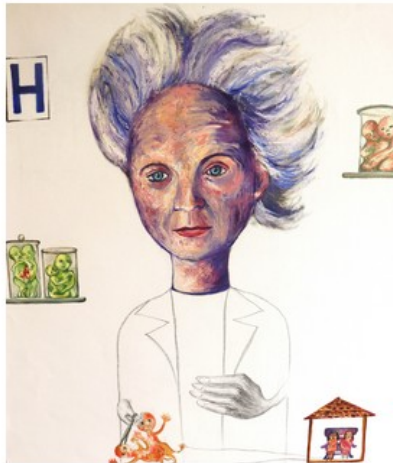
La chirurgienne, 2019