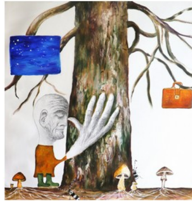
Le forestier, 2019