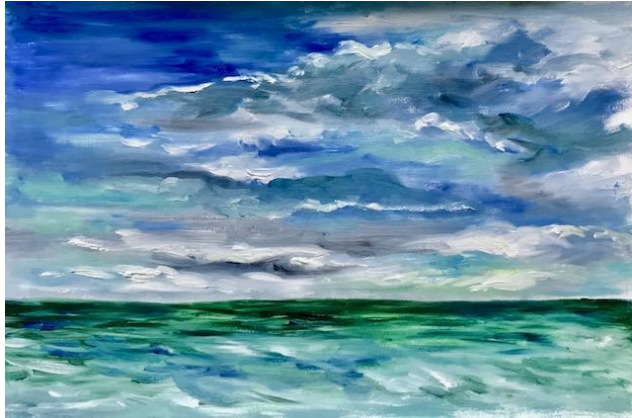
Cabourg, 2019 (Huile sur toile, 48x32 cm)