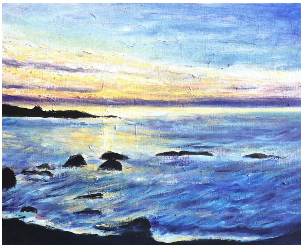
Cam Louis, Finistère, 2018 (Huile sur toile, 50x40 cm)

« Combattons, recommençons, persévérons, avec cette pensée que la haute mer se prolonge au-delà de la vie humaine, que même hors de la vie, l'immense navigation continue. Une vague qui pense, c'est l'âme humaine. »