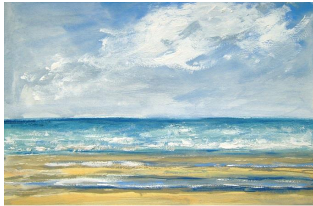
Dunes, 2018 (Gouache sur papier, 23x38 cm)