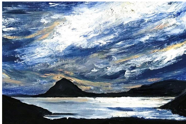
Nordhurfjordhür, 2018 (Huile sur toile, 22x16 cm)