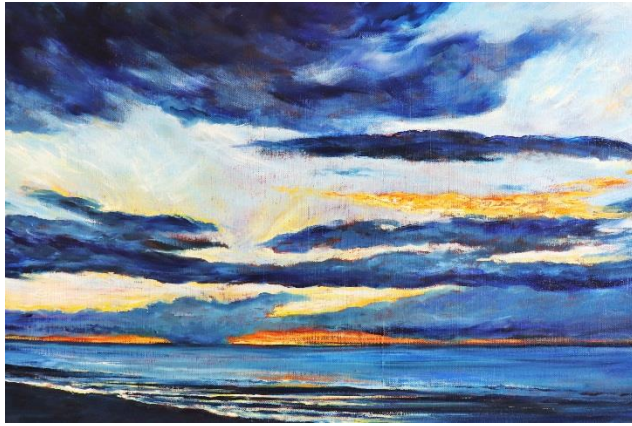
Cabourg, 2019 (Huile sur toile, 55x65 cm)