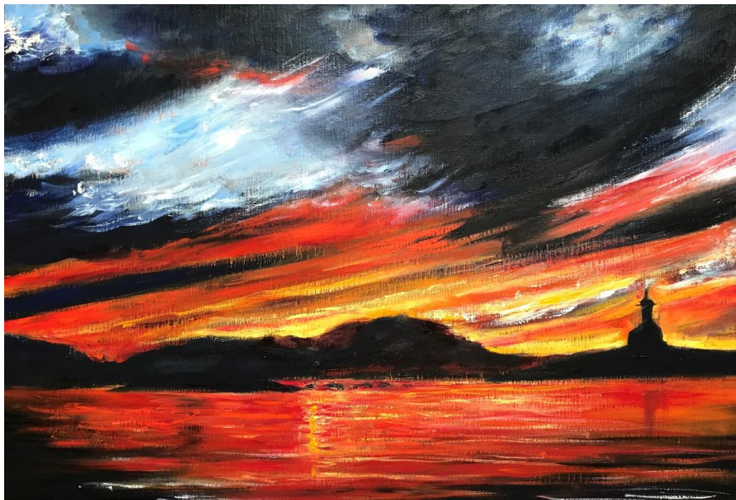
Lilia, 2018 (Huile sur toile, 38x55 cm)