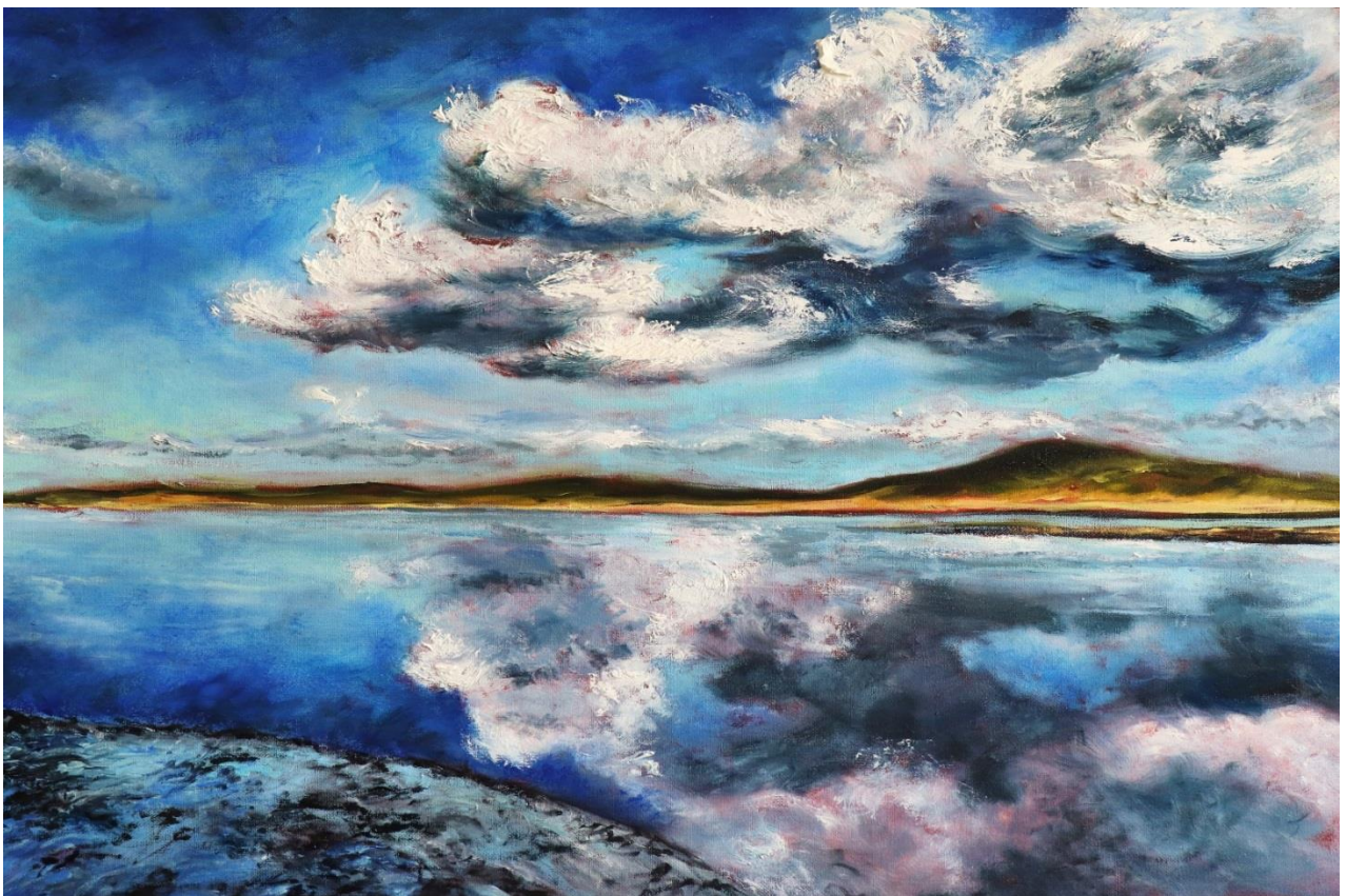
Baie de Canche, 2019 (Huile sur toile, 54x65 cm)